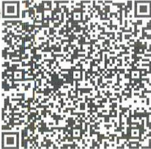
Sello digital del emisor

Subtotal 226.72 IVA 16% 36.28 TOTAL 263.00